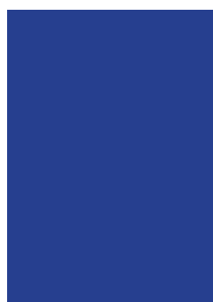
PÁGINA 210x297 mm