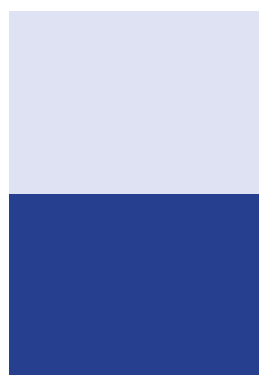
MEDIA PÁGINA 210x148,5 mm